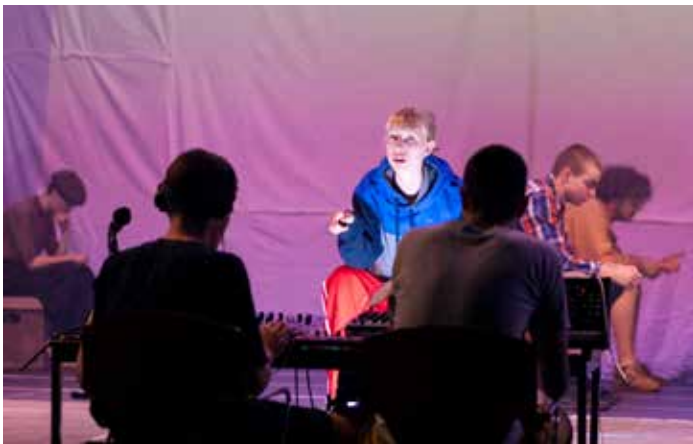
Der spielmitte e. V. begleitet junge Menschen mittels Theaterarbeit. Neue technische Ausrüstung half beim Lockdown.