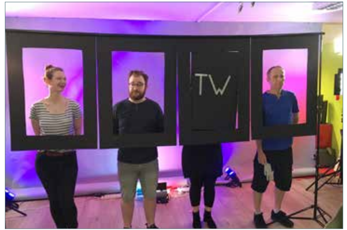
Beim Projekt „Fernbedienung“ des ImproTheaters Steife Brise konnten Zuschauer live oder von zu Hause aus mitmachen.