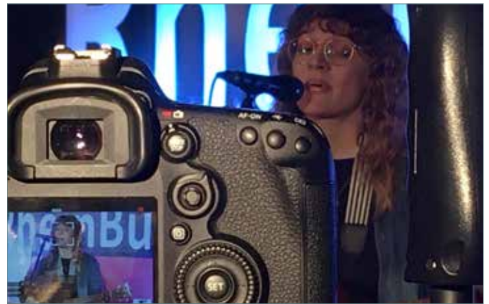
Das RheinBühne Kulturwohnzimmer ermöglicht jungen Talenten, sich selbst und eine Bühnenroutine zu entwickeln.

und Publikum gemeinsam Geschichten über Onlineplattformen entstehen lassen. Mithilfe der „Neustart Kultur“-Förderung konnte das Erzähltheater Osnabrück entsprechendes technisches Equipment anschaffen, um auf hybride und digitale Veranstaltungen umzustellen. www.erzaehltheater-os.de