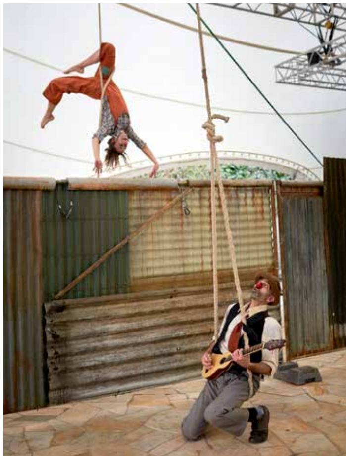
Die Theatercompany Drehbühne Berlin verbindet Theater und Film interaktiv.

Raum: einen ozeanblauen Zug mit elf Waggonen, die unter anderem Büros, Werkstätten, Ausrüstungs- und Vorratslager, einen Speisewagen sowie Wohnschlafwagen für bis zu 17 Personen enthalten. Mit dieser verkehrstauglichen Eisenbahn fährt das Ensemble auf öffentlichen Schienen von ihrem Heimatbahnhof Schiffdorf im Landkreis