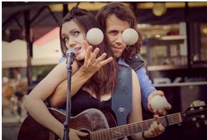
Felice & Cortes überzeugen mit einem Mix aus Jonglage, szenischen Elementen, Stop-Motion-Filmen und eigens komponierter Musik.

Unter dem Slogan „Kreativität x Mut x Innovation“ verleiht die DTHG in diesem Jahr zum insgesamt vierten Mal den Weltenbauer Award. Prämiert wird in drei Kategorien die jeweils beste Konzeptidee aus den „Neustart Kultur“-Förderanträgen, die die DTHG durch die Betreuung der beiden Teilprogramme „Pandemiebedingte Investitionen“ sowie „Erhalt und Stärkung der Infrastruktur für Kultur in Deutsch-