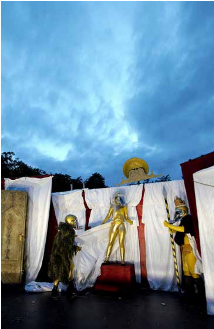
Bei der Wanderbühne des Theaters Carnivore spielen Masken und Maskerade eine entscheidende Rolle.

Wäschekorb kennt keine Grenzen des Machbaren. Denn Srivastava kommt ohne Bühnenbilder und mit nur wenigen Requisiten aus. Durch die „Live Kultur“-Förderung konnte Srivastava regelmäßige Aufführungen der drei Theaterstücke „Rumpelstilzchen“, „Frau Holle“ und „Der Froschkönig“ am Märchenbrunnen im Friedrichshainer Park in Berlin realisieren. Utensilien zum Infektionsschutz integrierte sie spielerisch in ihre Darbietungen.