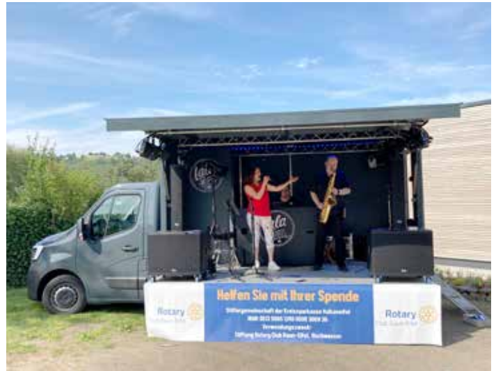
Das flexible „LaLa-Mobil“ des Dauner Duos Piano & Voice bietet die technische Ausstattung einer professionellen Bühne.

+49 (0) 6221 / 43204 -0 info@skena.de | www.skena.de