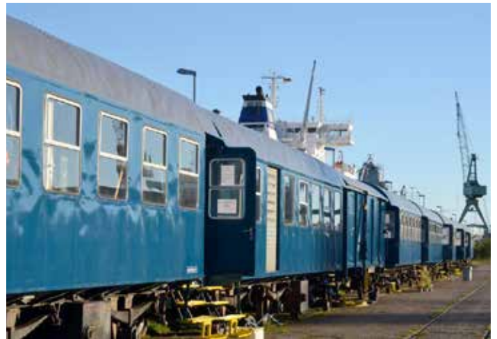
Der ozeanblaue Zug mit elf Waggons des Theaters Das letzte Kleinod fährt auf öffentlichen Schienen zu Auftritten vor Ort.