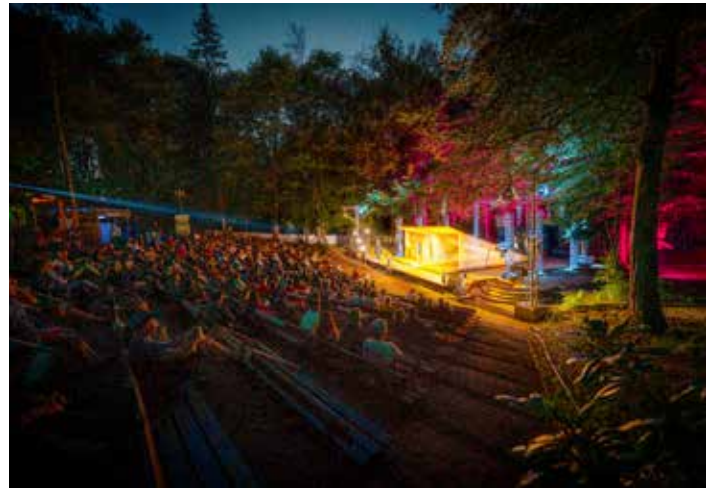
Das Festival Theaternatur investierte in die Sanierung der historischen Waldbühne Benneckenstein.