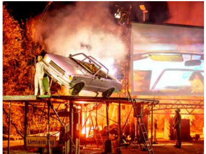
Im SpaceLab des Theaters Titanick wird experimentelles Theater im öffentlichen Raum erforscht; hier entsteht „TRIP OVER“.