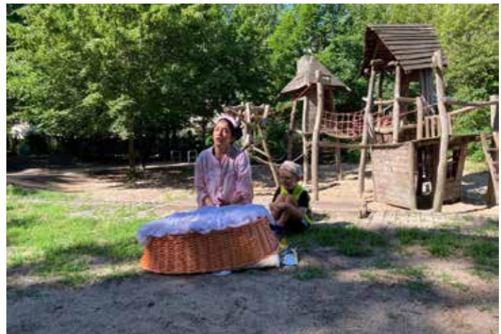
Das Theater aus dem Wäschekorb kommt ohne Bühnenbilder und mit wenigen Utensilien aus – alles wird zur Bühne.

Die Kategorie „Bestes Outdoor-Konzept“ umfasst Produktionen, die aus den Spielstätten hinaus gehen und das Livetheater im Freien stärken. Die vier Finalist:innen in dieser Kategorie sind: