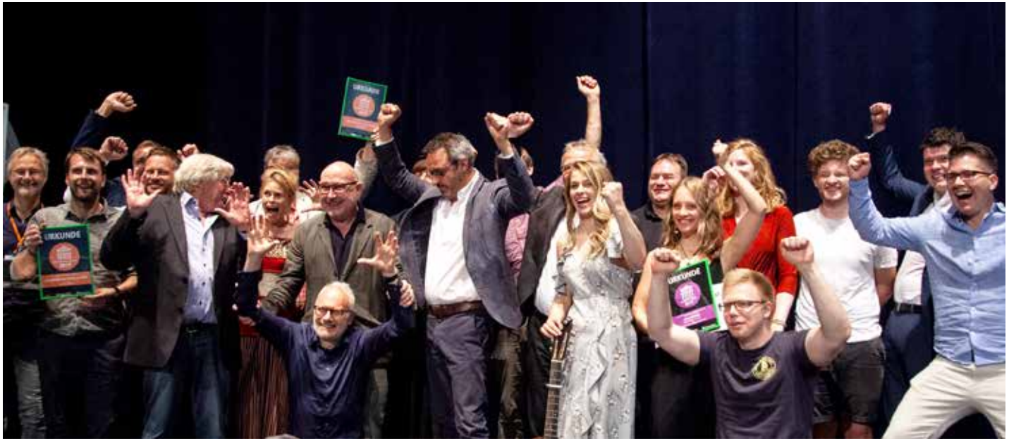
Große Freude bei der Preisverleihung: die Gewinner der Weltenbauer-Awards 2019 zusammen mit der Jury.

immer größere Aufmerksamkeit: Er ist Inspiration, Diskussionsort, Laboratorium und Arbeitsfeld für inter- und transdisziplinäre Formen der zeitgenössischen Kunst. Das SpaceLab will neue Formen des Theaters im öffentlichen Raum erkunden und dient nicht nur dem Theater Titanick als Entwicklungs-, Probe- und Veranstaltungsort. Mithilfe der „Neustart Kultur“-Förderung wurden hierfür die Besuchendensteuerung optimiert sowie pandemiegerechte Schutzeinrichtungen und Technik angeschafft – unter anderem eine große Leinwand –, um mehr Menschen sowohl indoor als auch outdoor empfangen zu können.