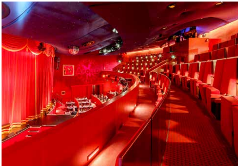
Das Roncalli's Apollo Varieté kombiniert gehobene Gastronomie mit Live-Entertainment, das einen Mix aus Pantomime, Schauspiel, Slapstick, Musik, Gesang und Tanz bietet.

Jenes reicht von Pantomime und Schauspiel über Slapstick bis hin zu Tanz und Gesang und bildet die Vielfalt des Varietés auf ganzer Linie ab. Die Möglichkeit, Gästen Bühnenunterhaltung inklusive Dinner zu bieten, macht Roncalli's Apollo Varieté auch für Unternehmen