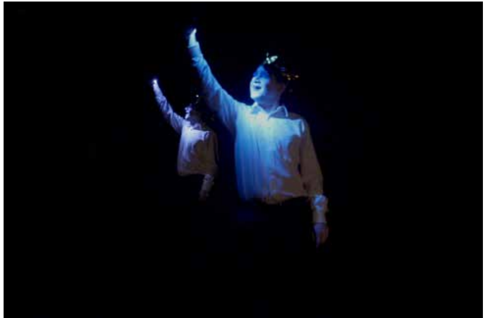
Experimente, Dialog, bewusste Verlangsamung: Das zwanglose „Slow Acting“ im TheaterLabor TraumGesicht bringt Talente zum Vorschein und ermutigt zum Perspektivwechsel.