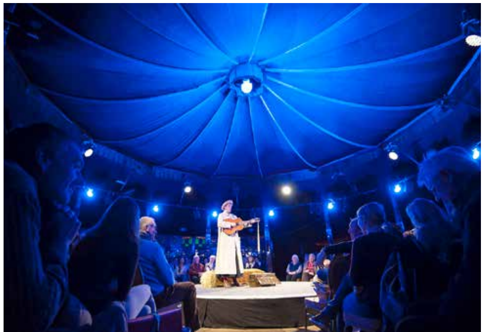
Über 10.000 Zuschauer:innen in zwei Monaten: das Wintertheater mit seiner „Braunschweiger Weihnachtsgeschichte“ im Spiegelzelt in der Innenstadt.

Seit drei Jahren wird zusätzlich die gegenüberliegende Kirche als Veranstaltungsort